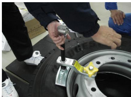
④32mmソケットをセット。