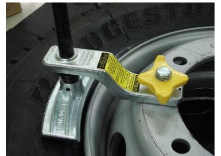
③上部からナットをしっかりと締めます。