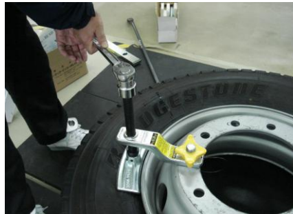
⑤レンチを回します。