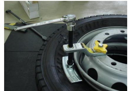
⑥ハンパを乗り越えビードが落ちます。

ニッポン・テック・インコーポレイテッド 〒108-0074 東京都港区高輪2丁目21番43号 YCC高輪ビル5階 TEL 03(5462)7631 FAX03(5462)7406 http://www.tech-jp.co.jp