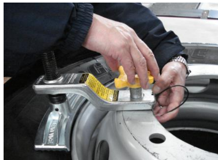
②下側からボルトを通します。