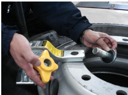
①ボルト穴に本体の穴部をセット。