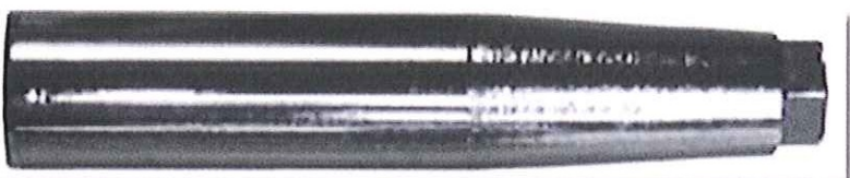
A130L ホイールセンタリングガイドL