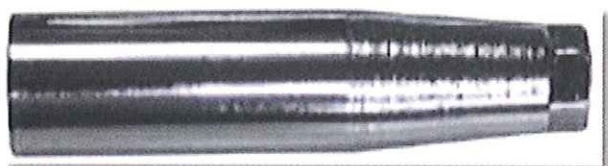
A100S ホイールセンタリングガイドS

ISOホイールはJISタイプと異なり、ホイールセンタリングのための球面座がありません。22mmのボルトが26mmのホイール穴(平面座)を通るためセンターが出ません。センタリングガイドを対角にセットしてホイールを通すことで確実なセンター出しができます。